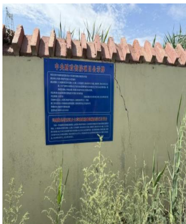
图示 1- 项目公示牌